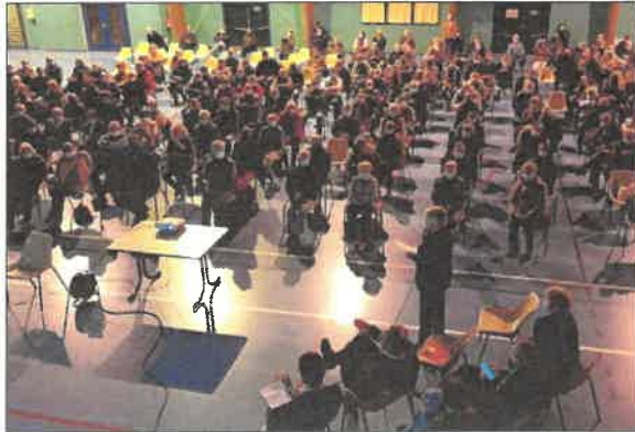
Environ 300 personnes ont participé à la réunion publique organisée par la mairie jeudi soir.